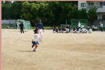
ホームまで 突っ走れ!