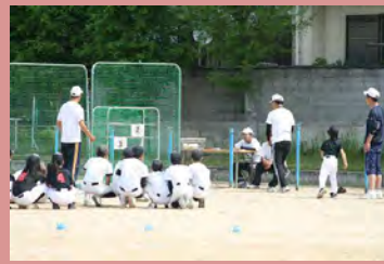
やった~ 1番 抜いたぞ~