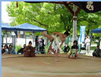
見事な土俵入り よいしょ!