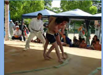
上手投げ!! のこったのこった