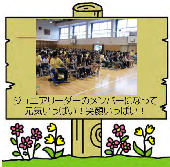
ジュニアリーダーのメンバーになって 元気いっぱい！笑顔いっぱい！