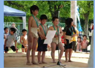
団体優勝 四条っ子チーム おめでとう