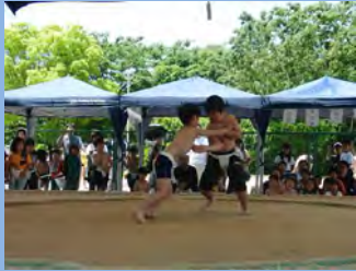
低学年のこどもたち がんばれ!