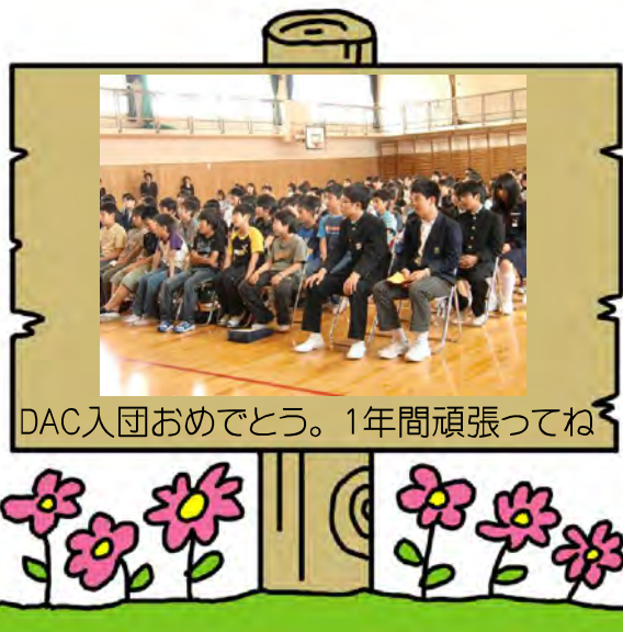
DAC入団おめでとう。1年間頑張ってね