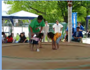
女の子も はっけよい!