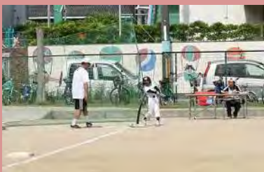
ナイスバッティング