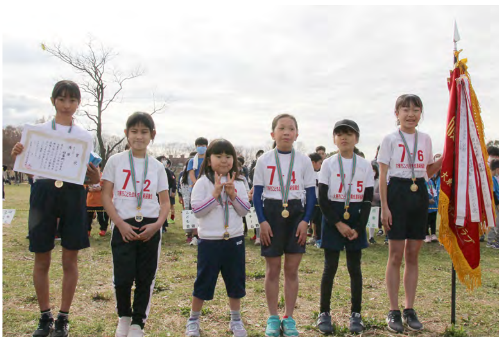
駅伝大会 女子の部 優勝 四条北ハピネス