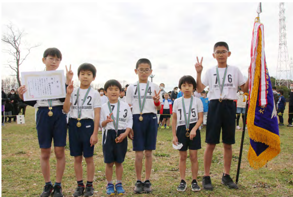
駅伝大会 男子の部 優勝 四条北ファイターズ