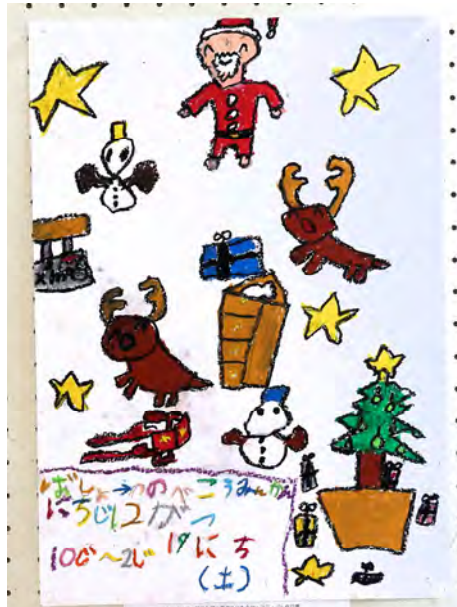
四条北B 津の辺こども会 1年生 延山 諒 作品名:サンタサンはいえ