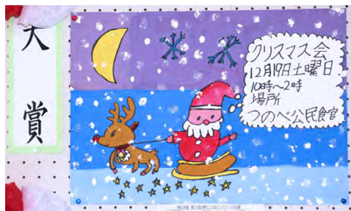
四条北B 津の辺こども会 3年生 堀江 心奈 作品名：夜空のクリスマス