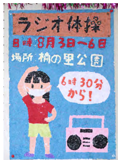
四条北B 中楠の里こども会 6年生 間 舞桜莉 作品名：ラジオ体操