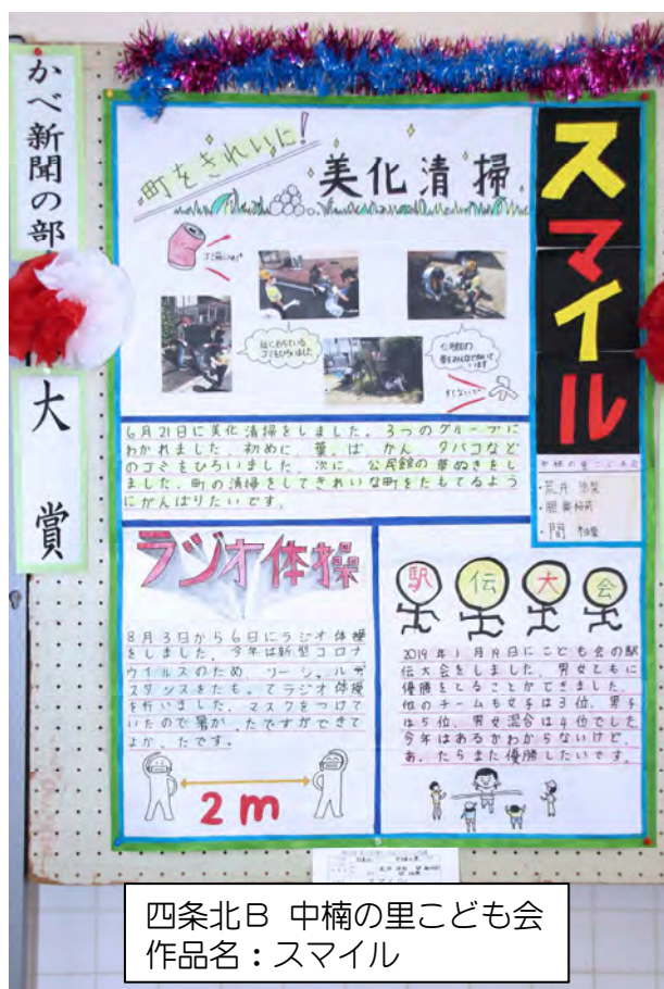
四条北B 中楠の里こども会 作品名：スマイル