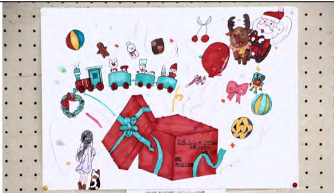
四条北B 津の辺こども会 6年生 福島 結愛 作品名：プレゼント箱から・・・