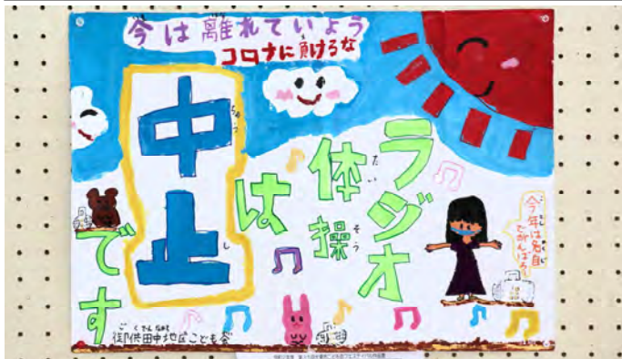
住道第一B 御供田中地区こども会 5年生 乾 夢渚 作名：ラジオ体操は中止です～今年は離れてがんばろう～