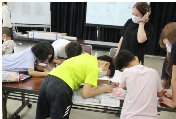
かべ新聞の作り方講習会