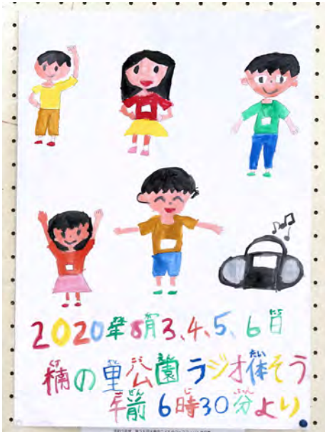
四条北B 中楠の里こども会 3年生 三浦 優里 作品名:ラジオ体操