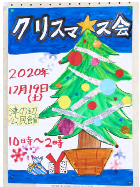
四条北B 津の辺こども会 4年生 三宅 潤 作品名：クリスマス会のポスター