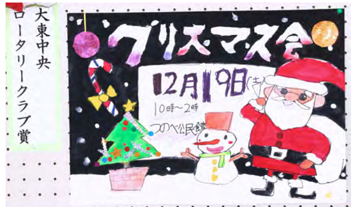
大東中央 ロータリークラブ賞 四条北B 津の辺こども会 2年生 三宅 賢 作品名：クリスマス会のポスター