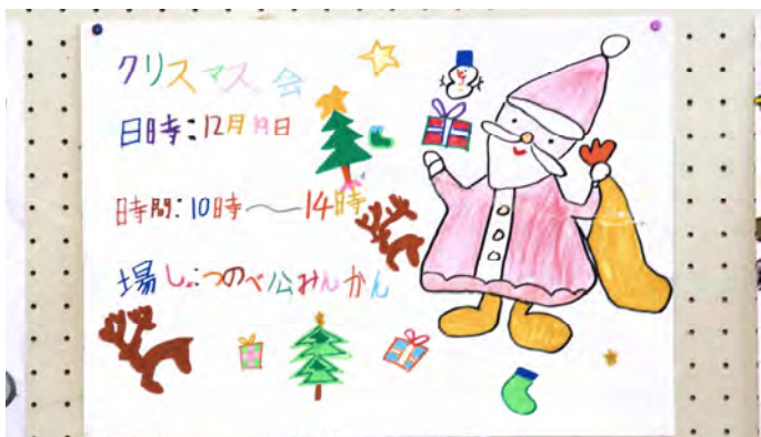
四条北B 津の辺こども会 2年生 太田 晃平 作品名:わくわく!! クリスマス♪