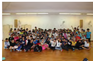
7月：サマーキャンプ