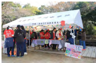
11月：野活祭だ！わっしょい!!!