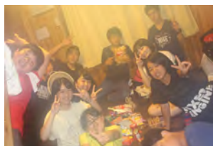
8月：リーダー(中3)引退&次の世代へ引継式！