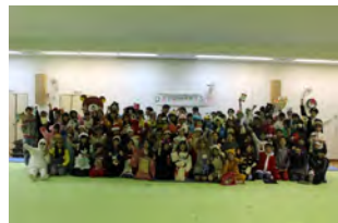
12月：DACクリスマス&大掃除