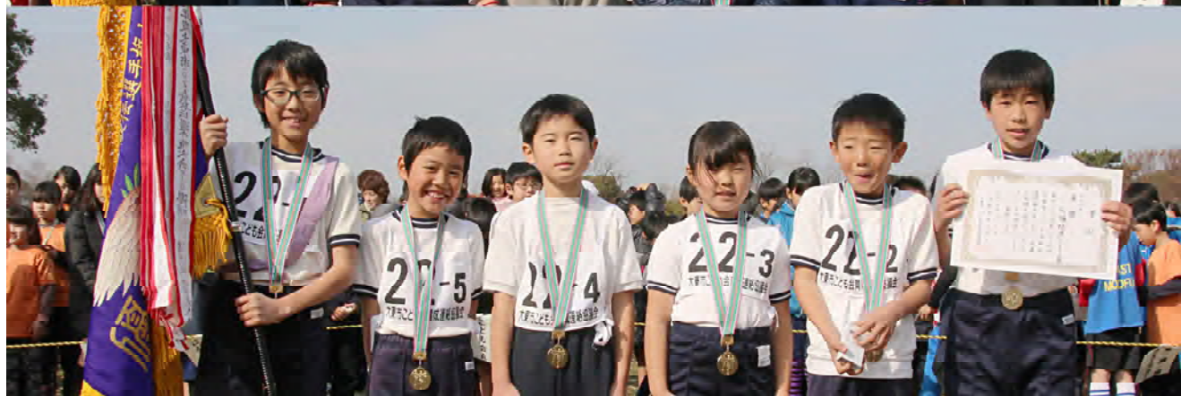
第35回大東市こども会駅伝選手権大会 優勝チーム 四条北ハピネス（上段） 灰塚地区子ども会（下段）