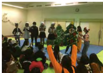
12月:DACクリスマス&大掃除