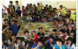
7月:サマーキャンプ