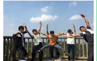
10月:遠足 inほした園地