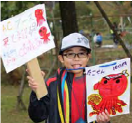
11月:野活祭!わっしょい!!!