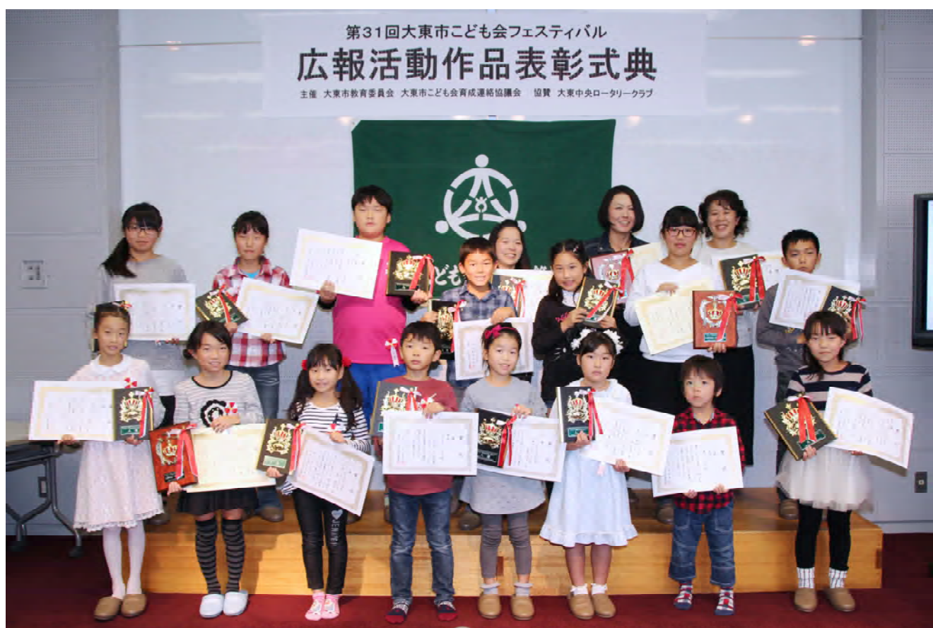
第31回大東市こども会フェスティバル 広報活動作品表彰式典