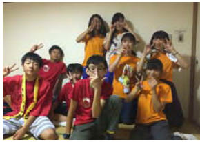
8月:リーダー(中3)引退&次の世代へ引継式!