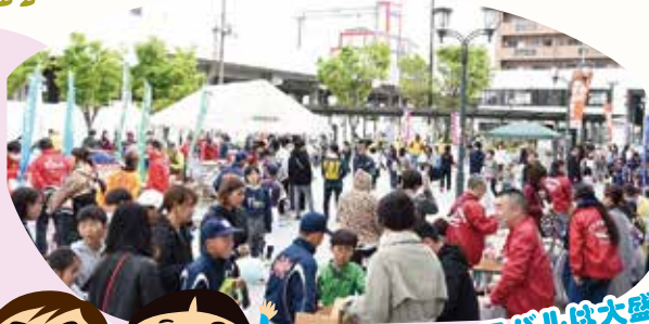
カーニバルは大盛況!

年に1回子ども会カーニバルを高石駅前広場で開催。(令和2・3年度はコロナで中止)市内の協力団体と的あてや輪投げ、わたがし・ポップコーンなどを出店し、多数の参加者で盛り上がります。その他、工場見学や1泊キャンプ、オセロ大会、アイススケート大会なども行っています。