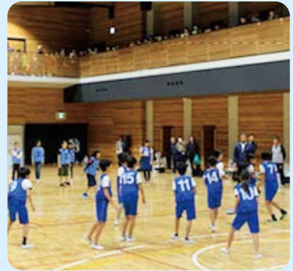
試合は白熱! でも終了後にはみんなトモダチ!