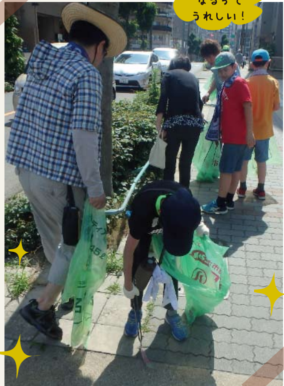
クリーンキャンペーン

このように、名古屋市子連では、名古屋市が行う地域ぐるみの活動に賛同し、積極的に連携を図っていくことで、子ども会活動に理解を図ってもらうとともに、子ども会の育成者・指導者として、名古屋市の子どもの健全な育成のため、少しでも力になれるよう、日々努めています。