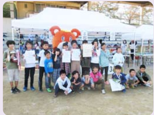
団体優勝「阪南市こ連」が優勝しました!