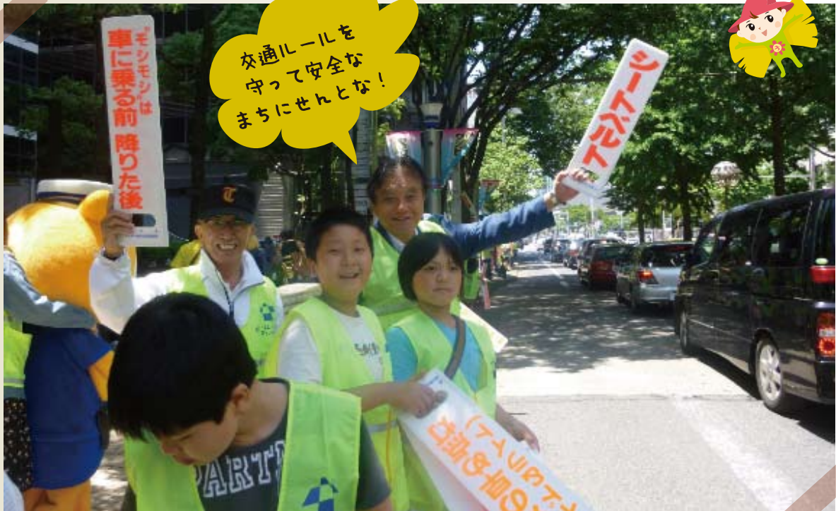
交通キャンペーン