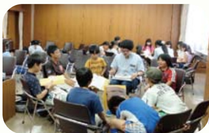
目標やリーダー像について考えています