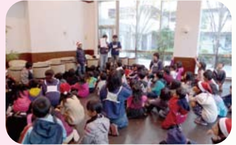
地域でクリスマス会等の行事をジュニアリーダーが運営

この冬も多くのジュニアリーダーが活躍し、「ジュニアリーダーが自信をもって役割を担ってくれて嬉しかった。」「ジュニアリーダーの表情が生き生きしていた。」「子どもたちの力に感心した。」など、育成者から成長を喜ぶ声をお聞きしています。