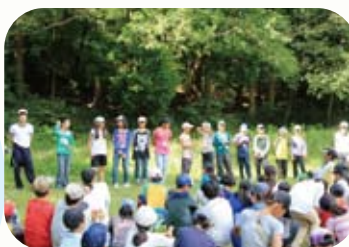
ジュニアリーダー企画にチャレンジ!

このキャンプを通じて得た達成感や感動、そして生活を共にしたキャンプカウンセラーや仲間たちとの絆は、子どもたちの大切な宝物となります。