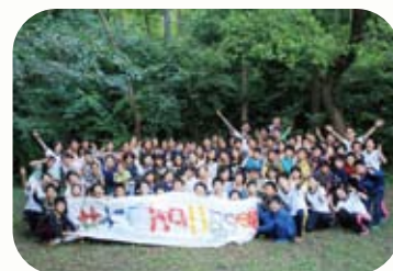
このキャンプは宝物!