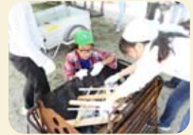
大阪狭山の新組み